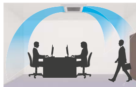
Abb.: Mit gleichzeitiger Swing-Funktion

angepasst werden. Das Resultat: Effiziente Luftkühlung unter Berücksichtigung des Raumkonzepts. Das moderne Blendendesign rundet das Komfortpaket ab.